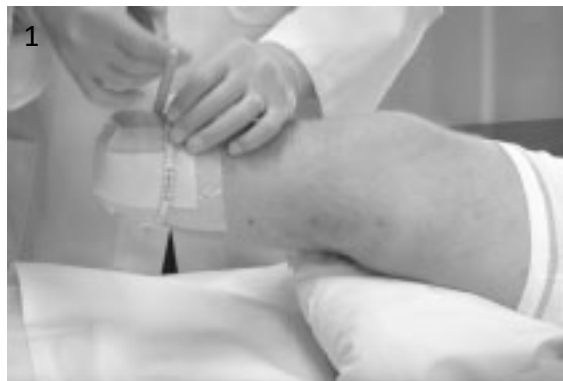
Mål omkrets av stump 4 cm opp fra stumpende.

18, 20, 22, 23.5, 25, 26.5, 28, 30, 32, 34, 36, 38, 40, 42, og 45